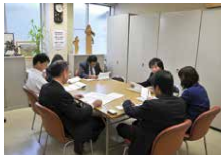
営業部 「商材の研究(名刺・DM・チラシ)」