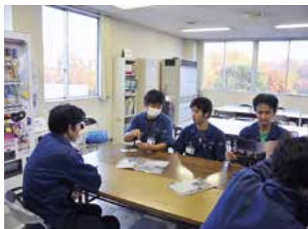
印刷課 「トラブルを未然に防ぐための勉強会」

今回の勉強会では営業部、総務・管理、制作、印刷、製本のグループに分かれ、上記テーマに基づいて勉強会を行っていただきましたが、各グループそれぞれに勉強会の内容や進行について独自で考え実践していただきました。