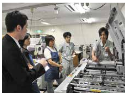
製本課 「製本作業について(機械の操作方法)」