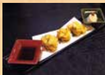
きくわた天ぷら 880円

続いてきくわた天ぷら。食べた瞬間、「んっ?」と思う様な食感…。とろっふわ～? どう表現したらいいかわからないの