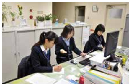
総務部・管理課 「総務の基本と職場のルール」