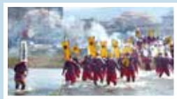
高坂隊出撃！本当に川を渡ってます！