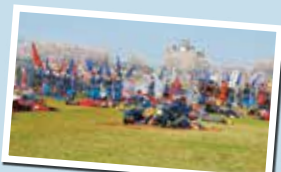
川中島合戦の再現。市職員・地元の高校生たちが甲冑をまとい、本番さながらの迫力で戦いました。