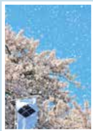
合戦が始まるのを待っている間、大量の桜吹雪が！観客席からどよめきが起きました。