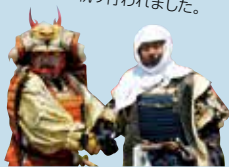
上杉謙信・武田信玄、キセキの握手！特別大サービスです！！