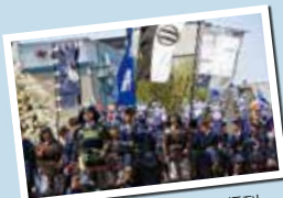
総勢千数百人に及び上杉行列。沿道が人波で埋め尽くされます。