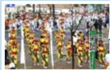
色とりどりの衣装に身を包んだ踊り手が、市内を練り歩きます。