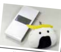
仙台のゆるキャラ むすび丸！