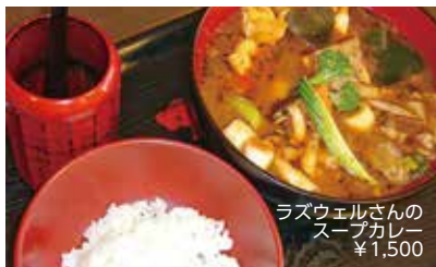
ラズウェルさんの スープカレー ¥1,500

でっかい豚の角煮、厚揚げ、こんにゃく、にんじん、ごぼう、大根、ネギ、トマトと具沢山！カレーだけでもお腹いっぱい！スープカレーは辛そうというイメージがありましたが、辛さもバリエーションがあり、自由を選べます。スープはあっさりとしてっ तरीからお好みをチョイス！豊富なメニューからお気に入りを探してみてください。