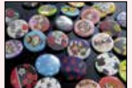
戦国の杜様ワークショップ オリジナル缶バッチ