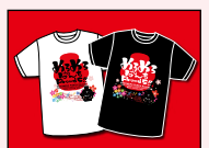
メロメ様 バンドTシャツ

お客様の期待を1%でも上回る! ことを念頭においてこれからも頑張ります! 以上企画室でした~。