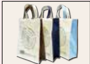
山形大学工学部様 100周年記念バッグ