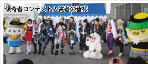
傾奇者コンテスト入賞者の皆様

「傾奇者コンテスト」も行われ、かなり盛り上がっていました。出場されるだけあって、皆様珠玉の出来映え！出場者が紹介される度に客席からは歓声が上がっていました。