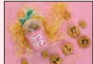
川島印刷×プランタン様 販促コラボクッキー