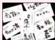
当社オリジナル製品 和尚しな名刺