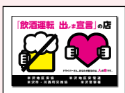
米沢地区交通安全協会様 飲酒運転撲滅ステッカー