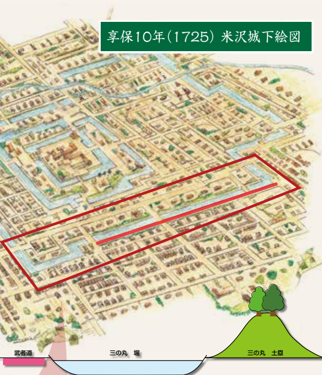
▲図1：武者道と堀の位置関係