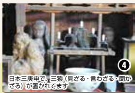
④ 日本三庚申で、三猿(見ざる・言わざる・聞かざる)が置かれています