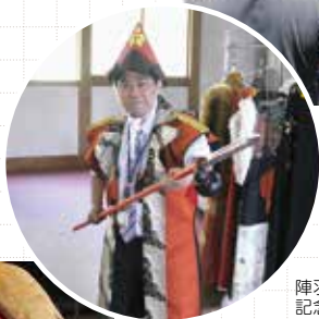
陣羽織を羽織って記念撮影もできちゃいます