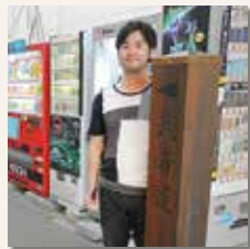
① 平和通りにある武者道入口