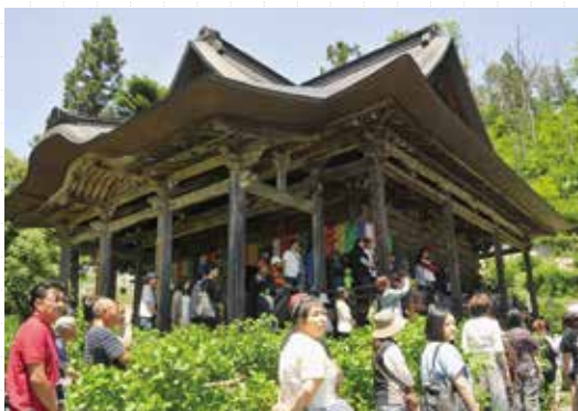
列は阿弥陀堂まで続きます

毎年6月4日に法要がありますので、皆さんもお時間があれば手を合わせて訪れてみてはいかがでしょうか。