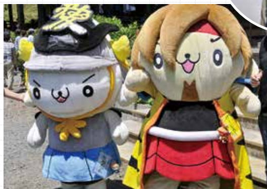
「かねたん」「けーじろー」ももちろん参拝