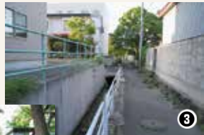
③ ◀ひっそりした細道が続きます