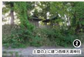
② 土塁の上に建つ西條天満神社