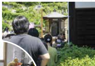
前田慶次供養塔へと続く参拝者の列