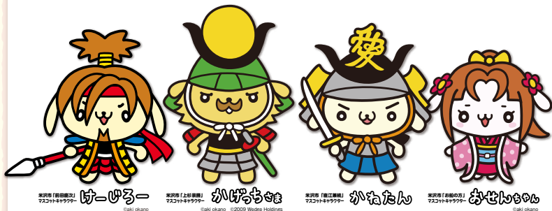
米沢市「東田地区」 72321-899999 かーゆろー

しかも、ウラ面デザインはなんと6種類! かねたん仲間達がゆる～く、楽しく節電を呼びかけてくれています。