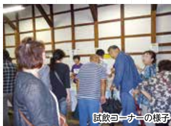
試飲コーナーの様子