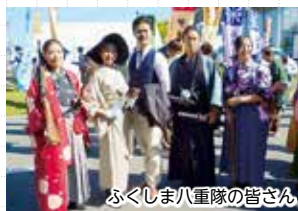
ふくしま八重隊の皆さん