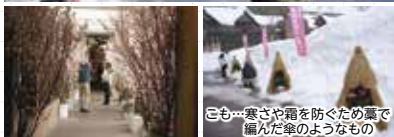
こも…寒さや霜を防ぐための藁で編んだ傘のようなもの