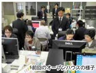
前回のオープンハウスの様子

来たる6月7日、第4回目を迎える川島印刷オープンハウスを予定しております。今回も、お客様一人ひとりに「ものづくり」の楽しさを体験していただくということで、“印刷工程体験会”を企画。普段は見えない、印刷会社の仕事の様子を実際に体験していただくことで、より身近に感じていただけるかと思えます。興味のある方は、ぜひお声がけください。