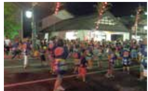
灯りのなか、にぎやかに行われました

16日は朝から雨で、お祭りが開催されるか不安でしたが、午後からは雨が上がりたくさんの参加者のもと、予定通りに「民謡パレード」が出発。沿道にもたくさんの見物客があり、今年も熱く活気のあるお祭りとなりました。