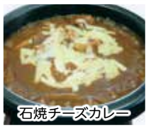
石焼チーズカレー