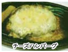
チーズハンバーグ