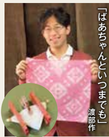
「はあちゃんといつまでも」