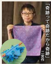
「奇跡って奇跡だから奇跡」