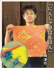
「にんじやりばんばん」