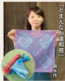
「どまんなか違和感」