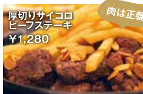
肉は正義 厚切りサイコロ ビーフステーキ ¥1,280

ニンニクの香りだけですでに美味しいというのに、普通に食べてよし、パケットと一緒に食べてよしと何度も楽しめます!