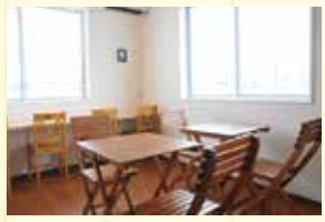
ゆったりと時間を過ごせるカフェスペース。スープやドリンクも注文OK！