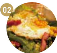
02 たまご屋さんのオリジナル シーザーサラダ ¥780