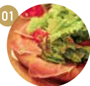
01 生ハムサラダ ¥780