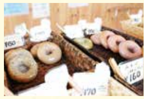
選んだベーグルにお好みトッピングを注文して食べることができます。

いま川島印刷社員でブームとなっているベーグルポコさんをご紹介します！ ご夫婦で営まれている、オレンジ色のかわいい外観が目印のお店です。 社内で評判が広がり、食べたいと声があがれば営業社員が買い出しに 駆け出される今日このごろ。 店内にはたくさんのおいしいベーグルが並び、思わず目移り！お好みのトッピング と組み合わせていただけるので、今日はどの組み合わせにしようか…と 何度も足を運びたくってしまいます！