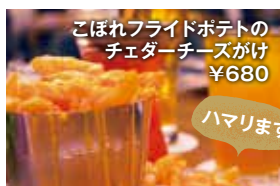
こぼれフライドポテトの チェダーチーズかけ ¥680

メニューを見た瞬間、衝動注文。肉しいビジュアルどおりのお肉感!今日から私の自分へのごほうびメニューに決定です。