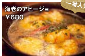
一番人気 海老のアヒージョ ¥680

ニンニクの香りだけですでに美味しいというのに、普通に食べてよし、パケットと一緒に食べてよしと何度も楽しめます!