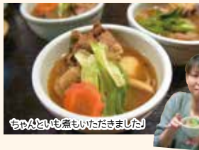
ちやんといも煮もいただきました!