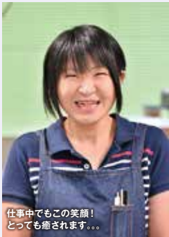
仕事中でもこの笑顔! とっても癒されます。。。