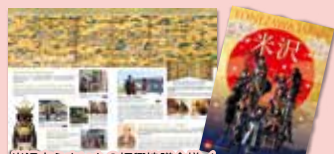
米沢市うまいもの振興協議会様/ 米沢市多言語観光パンフレット（英語・繁体字版）