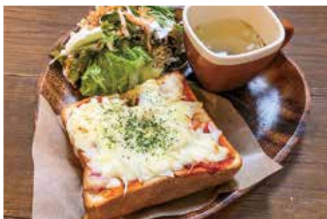
米粉厚切りピザトースト ¥980

KOMFORTAさんオリジナルのハンバーグ。ふわふわな食感と肉厚ジューシーな感じがたまりません…。デミグラスソースをつけて、モチモチな米粉パンと一緒に食べるとさらにおいしさがUP! サラダもボリューム満点で、野菜もたっぷり摂りたい!という方にもおすすめの一品です。