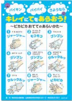
▲こども向け手洗いポスター

弊社公式Facebookでもご紹介しましたが、新型コロナウイルス(以下「コロナ」と表記)感染拡大予防として、子どもが楽しく手洗いを学べる「こども向け手洗いポスター」を制作しました。