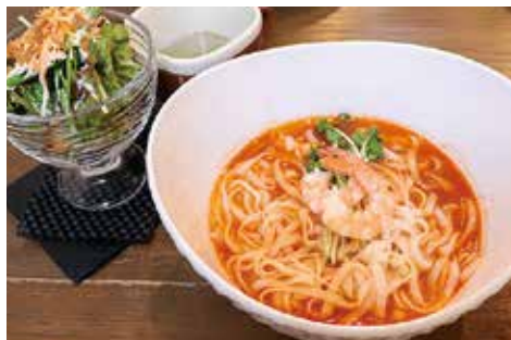
自家製米粉ヌードル(トマト) ¥950

米粉ヌードルのもちりとした食感、トマトの風味や海老のプリプリ感とも相性抜群です。喉ごしも良く、濃厚なスープに絡んでいて、スープまでペロリと美味しくいただきました。