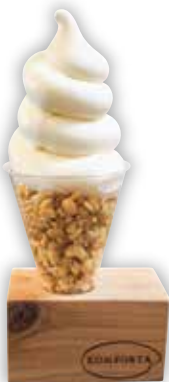
北海道ミルク \大人気/ ソフトクリーム ¥480

米粉で作られた食パンは、小麦粉の食パンよりも甘くてモチモチ。パンのミミもサクッと香ばしく、伸び～るチーズやケチャップの甘みも全て美味しかったです。サラダとスープが付いているので、健康に気をつけている方も美味しくいただけます♪(ちなみにメンバーのNさん…只今絶賛ダイエット中らしいのですが、取材当日は「せっかくの取材日だから!」とウキウキで楽しそうに食べていました。)