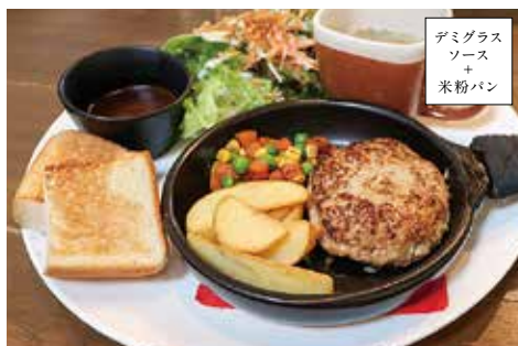
KOMFORTA ハンバーグ ¥1,000

焼きカレーのトロッと感、熱々だけで絶妙なとろみでとてもやみつきになります!チーズとカレーが少し焦げた焼き色は香ばしさをさらにプラスして、美味しい味を引き出します。カレー好きにはたまらない一品です。