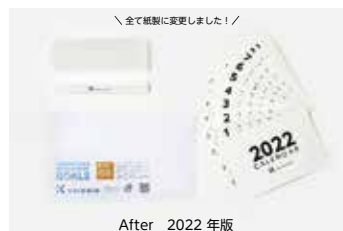
After 2022 年版