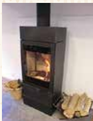
薪ストーブの暖かさに心が落ち着きました。

んまいもんたんけんたい取材班は、米沢市の小野川温泉「宝寿の湯（旧寿宝園）」様へお邪魔してきました。温泉街から奥へ、川を挟んだ高台にある宿です。日帰り入浴は午前中から受付を行っていて、入浴後にのんびりと過ごせるカフェスペースもあります。テーブル席とカウンター席があり、ゆったり空間。テーブルからの眺めもいので窓際がおススメです。窓の外に足湯があり、取材の最後にメンバー全員で足湯を堪能させていただきました。