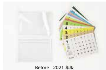
Before 2021 年版

川島印刷ではSDGsの観点から、年末年始のご挨拶用に配布しているオリジナル卓上カレンダーに使用していたプラスチックケースと個包装OPP袋を廃止し、すべて紙製品に変更しました。使用後は各パーツを分別無しでまとめてリサイクルできるように、材料・加工・労力全てにおいてECOなモノをつくりました。