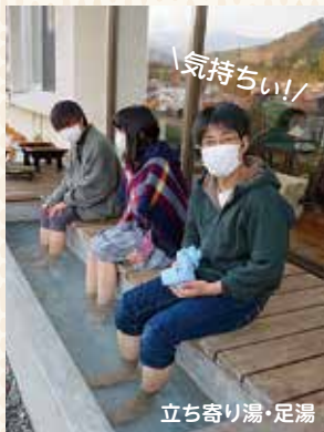
立ち寄り湯・足湯

足湯カフェも営業していて、温泉から上がった後は、ドリンクやアイスクリームが楽しめます。宿泊の際は、バーカウンターとしてアルコールもいただくことができます。