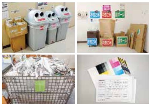
ごみの分別・リサイクル

社内で発生するごみの中には、ペットボトルや可燃ごみ、不燃ごみなどがあります。ペットボトルはラベルとキャップに分別し、缶・ビン・プラスチックに分けて回収ボックスにて分別を行っています。その他、印刷・断裁・製本等で発生した損紙等は、古紙回収業者へ依頼し全て古紙リサイクルしています。一般ごみは可燃ごみ・不燃ごみとダンボールに分別し、できる限りのリサイクルを図っています。社員全員が分別・リサイクルを意識し取り組んでいます。ごみの削減はこれからも続く課題の一つです。私たちにできることを続けていきたいと思えます。