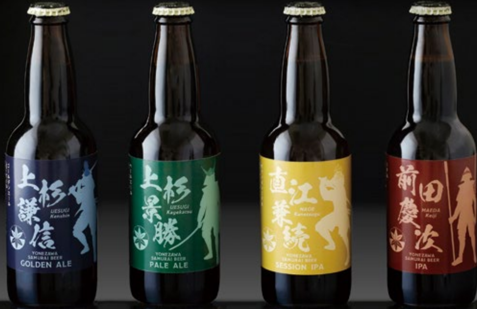
上杉謙信 ゴールデンエール