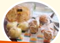
高校生作！紅花商品

令和4年度からは、多分野にわたった「オール米沢」での盛り上がりを図っています。「歴史と伝統がつなぐ～米沢に咲く、紅花。～」をテーマに、紅花の魅力を多くの方々と共有し、米沢らしいオンリーワンの紅花に対する温かい想いを市内全体に美しく咲かせていくことで、米沢に活気を取り戻し、世界農業遺産認定の機運をさらに高めていきます。みんなで目指そう!!『世界農業遺産』!!