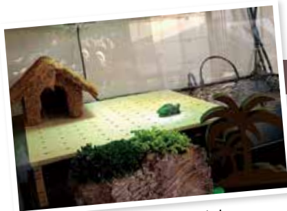
最初は500円玉くらいの大きさでした