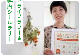
ドライフラワー＆ 社内シールラリー

社内各所にミニドライフラワーを飾り、シールラリーを開催。色んな方が参加してくれました！