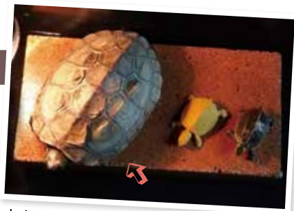
カメのフィギュアと一緒に日向ぼっこ

出張等で数日留守にする時は、自動餌やり機を探したり、水替えのタイミングを考えたりと大変なこともありましたが、病気になることなくここまで元気に育ってくれました。