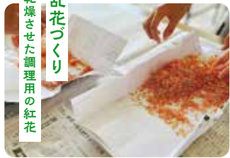
乱花づくり 乾燥させた調理用の紅花

花びらを摘み取り、乾燥させればできあがり。量を取るには結構な紅花の数が必要でした。